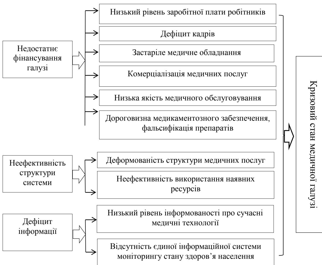
Рис. 1. Перелік факторів, що впливають на кризовий стан медичної галузі [узагальнено автором на підставі 1, 3, 4]

На рис. 1 представлений узагальнений перелік факторів, що впливають на кризовий стан медичної галузі.