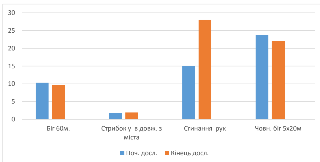
Рис.1. Динаміка розвитку фізичних якостей дівчат, що займаються хіп-хопом.

Порівняльний аналіз загальної фізичної підготовки дівчат, які займаються хіп-хопом (рис.1) показав, що приріст швидкості склав 0,4 с.